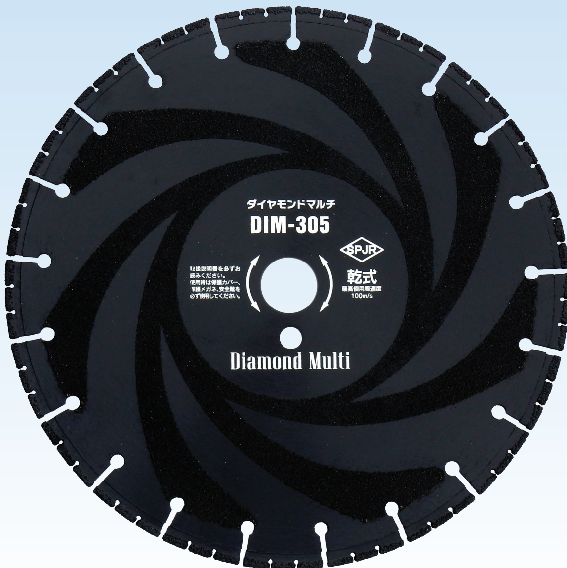
エンジンカッター用

鋳鉄管の切断に優れた性能を発揮! 鋳鉄管・鋼管・塩ビ管・FRP製品、石材などに。